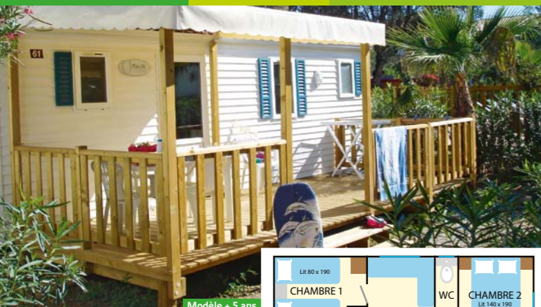
Modèle + 5 ans